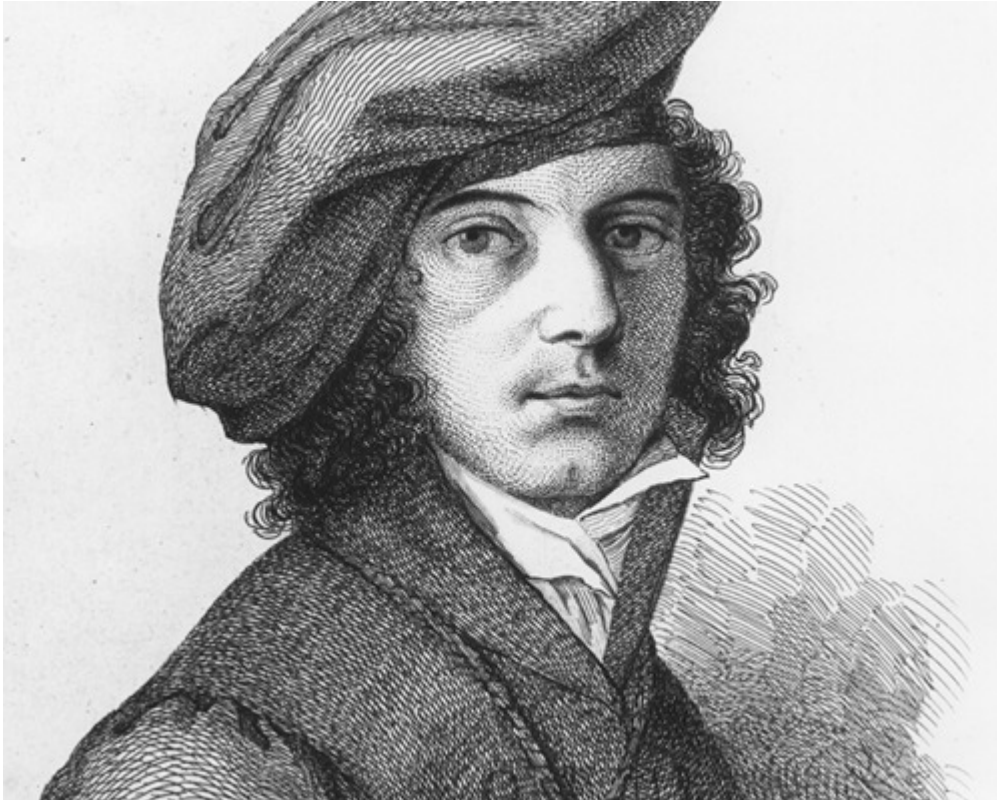
Adelbert de Chamisso (1781-1838). Delineavit E.T.A Hoffmann (1776-1822).